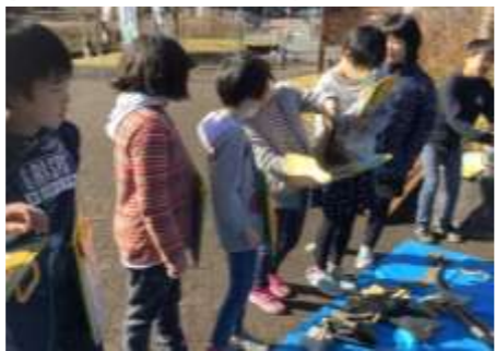
昔の道具を外に出してもらいました。