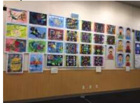
平面作品、丁寧に仕上げられていますね。