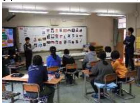
5年生 「Who is your hero?」