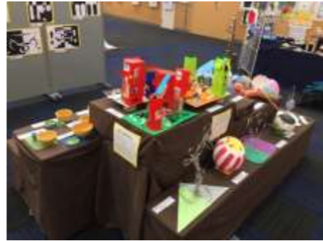
各学級の工夫が表れています。