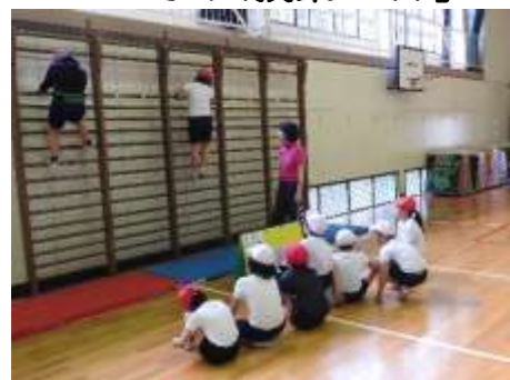
3年生体育。体を移動する運動。

☆2/20 奥多摩町教育委員会研究指定校 研究発表会 「心ときめく授業づくり」～授業のユニバーサルデザイン化を通して～