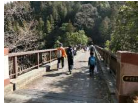
数馬峡橋から白丸湖を臨む。