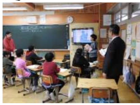
6年生「ぼくの夢 わたしの夢」