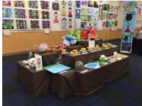
いろいろな素材を使った作品。