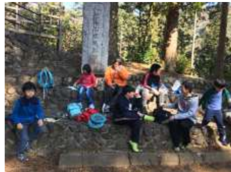
大丹波 青木神社でお弁当