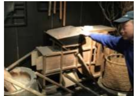
唐箕(とうみ)という道具です。

☆2/20 奥多摩町教育委員会研究指定校 研究発表会 「心ときめく授業づくり」～授業のユニバーサルデザイン化を通して～