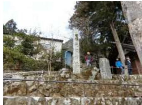
白丸探検 本栖神社。

ひまわり4年生の2人が、自分の住んでいる地域を調べ、その良さを発見し、仲間にフィールドワークで伝えました。