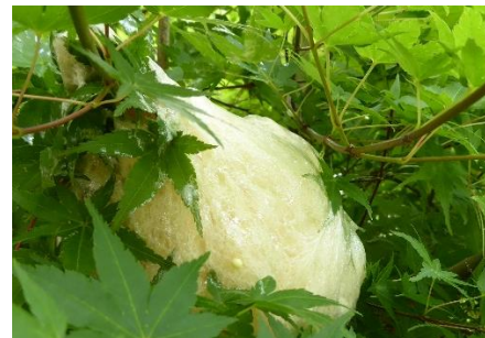
モリアオガエルの産卵