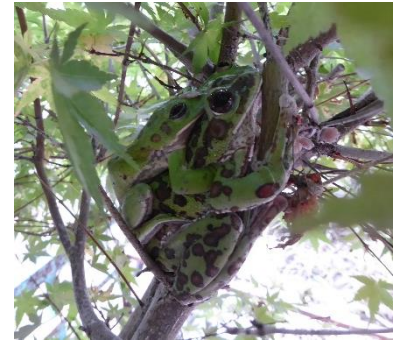
職員室前 木の上のエリアが 5/27

残り10か月となりますが、子供たちにとってこの一年は、それぞれの学年でしか過ごせない「かけがえのない一年」です。例年以上に一日一日を大切にしていきます。保護者の皆様にもご協力いただくことが多いと思いますが、よろしく願いいたします。