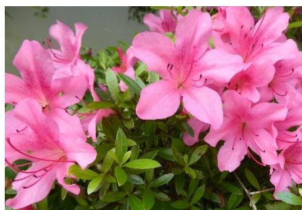
ツツジの赤が鮮やかです