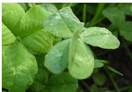
四つ葉がみつかりました