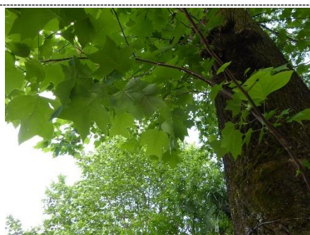
鮮やかなユリノキの緑