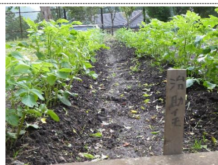
学校畑に治助芋を植えました

初夏のさわやかな季節になりました。6月1日から学校を再開することができます。児童の皆さんと毎日会えると思うと、本当にうれしい気持ちでいっぱいです。友達や先生とたくさん遊びましょう。思い切り体を動かしましょう。楽しく学びましょう。学校の主役は皆さんです。皆さんが安心して元気に過ごせる学校にしていきます。