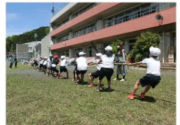
体力向上旬間の取組(全学年)