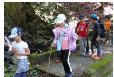
全校遠足(奥多摩むかし道)